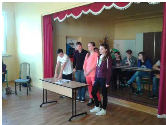
Występy na scenie.