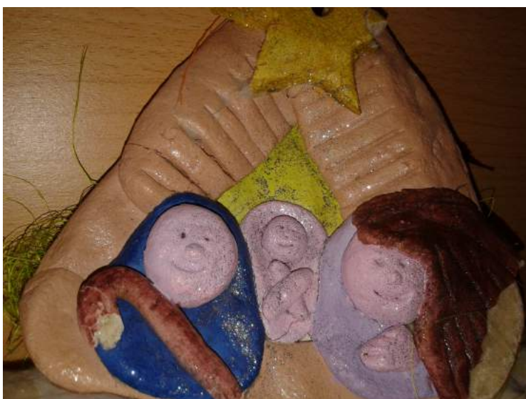
Szopka wykonana przez uczniów.