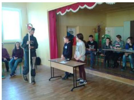
Występy na scenie.

- Witaj, słońce. Już wykąpana? - Jestem gotowa. Jak choinka? - Świećka wiszą, bombeczki błyszczą – prawie jak ty. - Super, a karp jest? - Wypuściłem... Był taki samotny... - Tato, gdzie moja czapka - Jest tutaj, proszę bardzo. - Faj, w czapce jest masło! Skąd się tam wzięło?