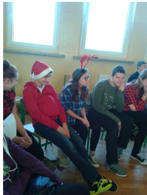
Mikołaj typowy, z grubym brzuchem i reniferem.