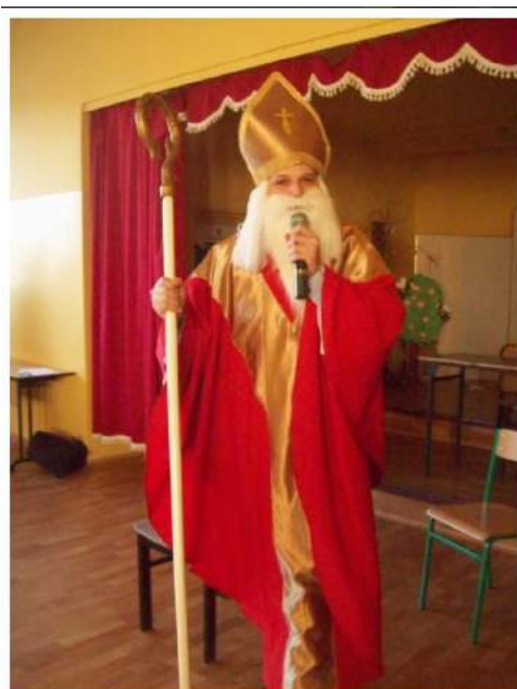
Nasz Święty Mikołaj. Prawdziwy biskup z pastorałem. Zbiory własne.